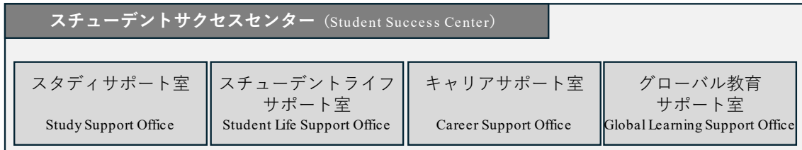
図 2 : スチューデントサクセスセンター

※SSC の HP は現在準備中です。必要な情報は引き続き旧全学教育機構の HP でお知らせしますので こちら をご覧ください。