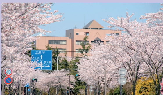
春の風景“阿見キャンパス”