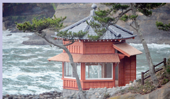
再建された茨城大学五浦美術文化研究所“六角堂”