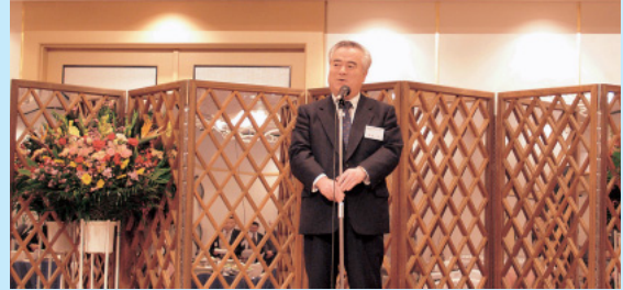
橋本昌茨城県知事からのご挨拶