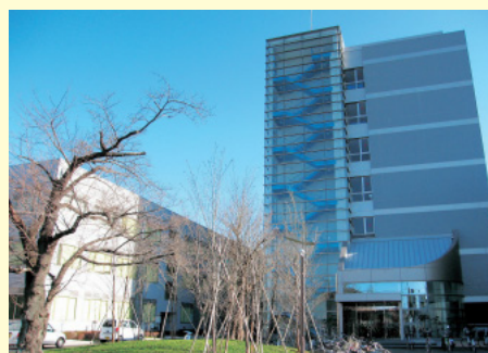
理学部総合研究棟（平成15年12月25日竣工）