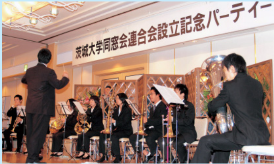
校歌演奏「本学学生サークル 吹奏楽団」

に卒業生を「茨城大学サポーター」に位置づけ、同窓会と大学間の橋渡し役となることが期待されています。また、地域社会へ開かれた大学を目指す一環としても連携・交流を活発化させ、地域社会への貢献を目指しております。