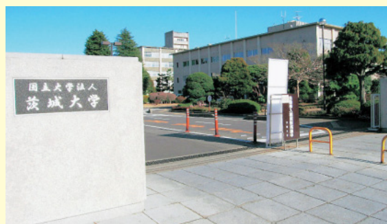
国立大学法人茨城大学正門（水戸キャンパス）